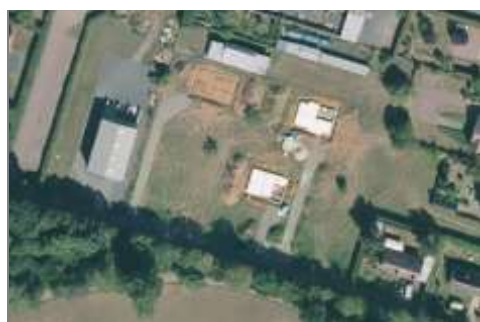
Chantier de maison

Espace où l'on constate un travail de la terre accompagné d'engins de travaux. Les espaces qui sont encore en finalisation de travaux sont ceux dont les bâtiments non pas encore de toiture, et le plus souvent quelques traces de surface imperméables autour.