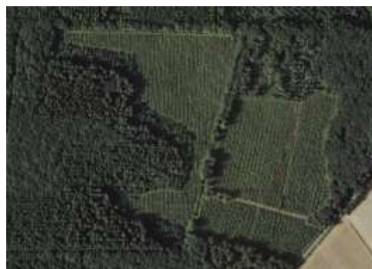
Coupe dans un bois