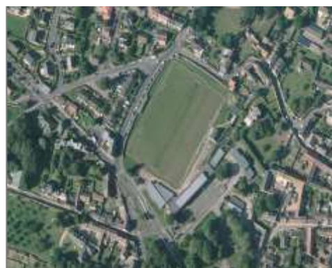
Terrain de football