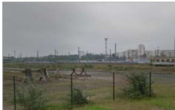
Gare de triage

Il s'agit de tout le réseau ferré d'une largeur supérieure à 5 mètres permettant le transport ferroviaire de biens ou de personnes. Les espaces associés à l'infrastructure ferrée sont à prendre en compte dans ce poste (bordure de chemins de fer, gares, espaces de triage)