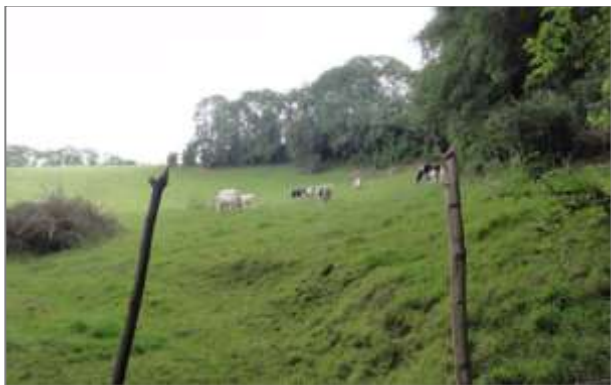
Prairie de pâture