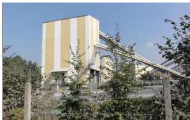
Extraction de matériaux