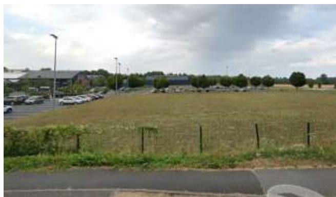
Terrain entre activité commerciale et agriculture