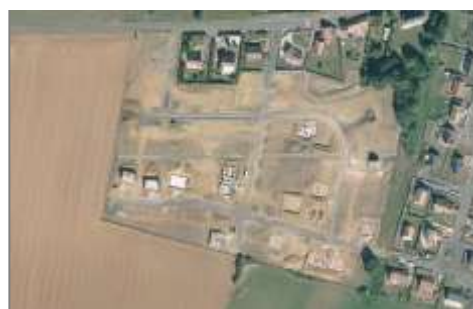
Chantier d'un lotissement