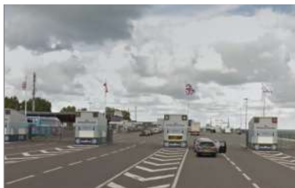
Quai de ferries