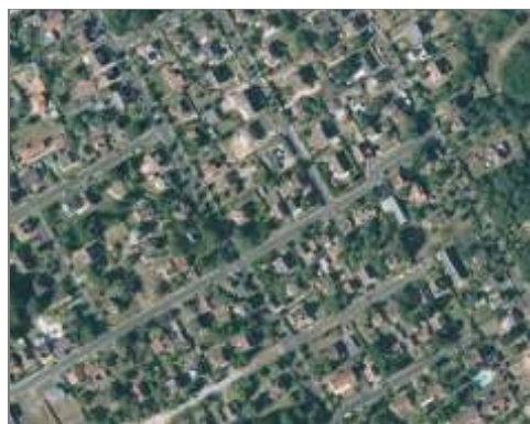
Maisons individuelles en lotissement

Des bâtis individuels collés les uns aux autres, pouvant être confondus avec le collectif (prendre en compte la donnée des hauteurs de bâtiments pour les distinguer)