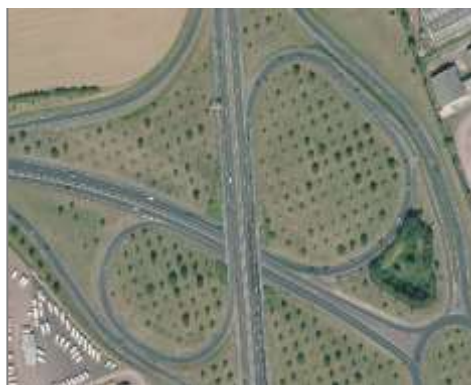
Espace boisé au sein d'échangeurs