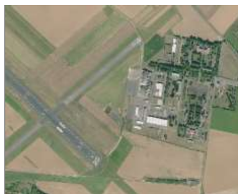
Hangars aéronautique attenants à la piste