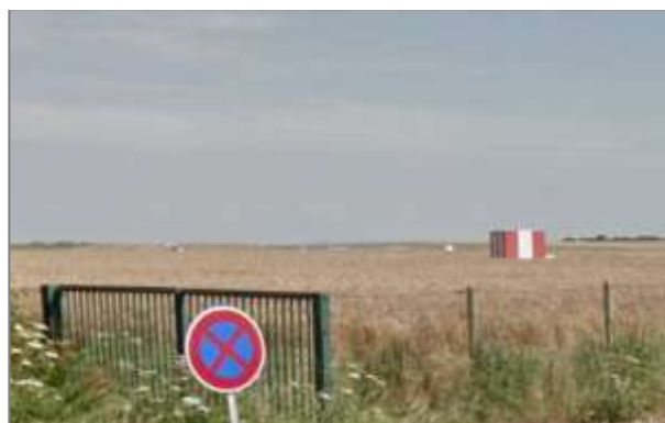
Espace associé à la piste