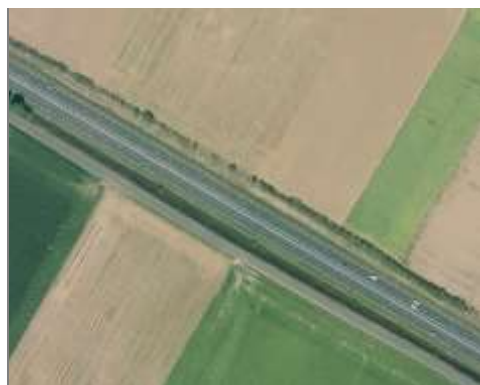
Route 2x2 voies

Bien distinguer les routes qui sont à l'intérieur des activités économiques. Elles ne seront pas prises en compte.