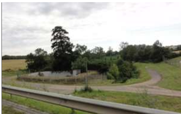
Bassin de rétention