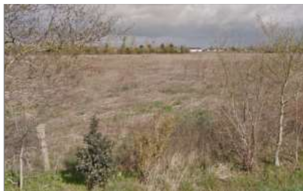
Prairie en friche

Code : US53 – En transition dans l'agricole