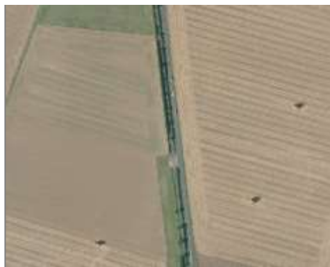
Piste cyclable le long d'une route