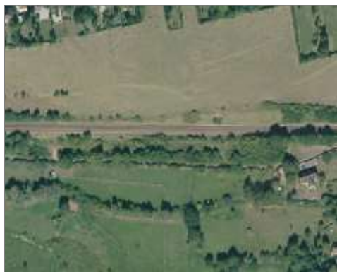
Voie ferré qui traverse une zone agricole

Les rails sont visibles comme du linéaire avec un aspect strié et une surface imperméable au sol (ballast).