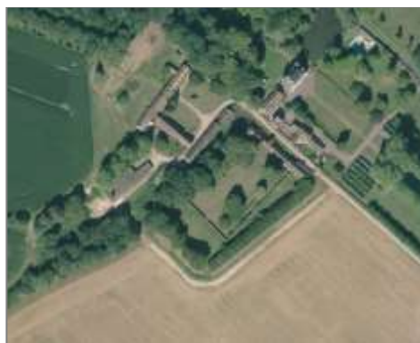
Bâti agricole et château