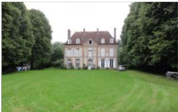
Château avec jardin