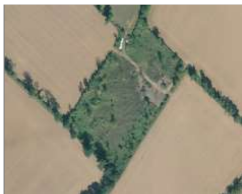
Friche dans une ancienne prairie

Espace où l'on constate un travail du sol mais sans indice d'activité récente ou d'engins agricoles. D'autres espaces n'ont pas de trace de travail du sol mais plutôt d'abandon.