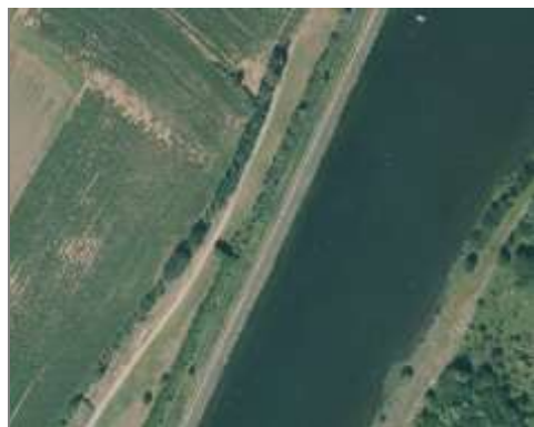
Sentier le long d'une berge

Ils sont souvent situés en bordure de routes majeures, en bordure de mer aménagée ou le long des parcs urbains.