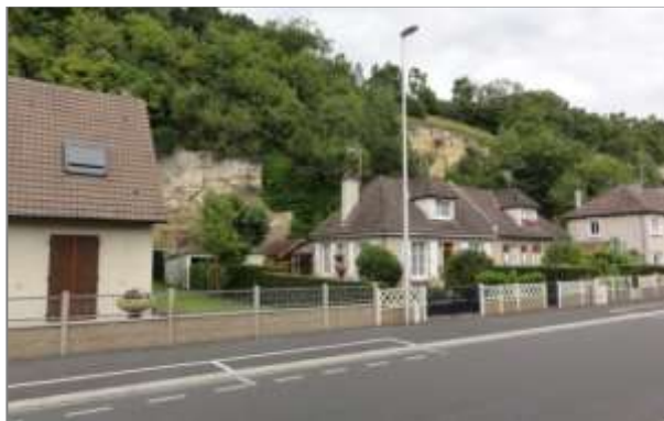
Maisons dans lotissement