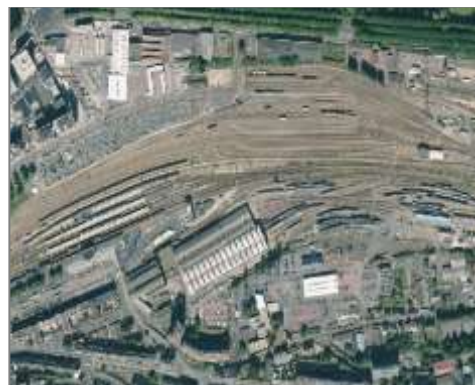
Gare centrale de Caen