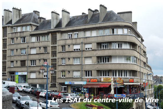
Les ISAI du centre-ville de Vire