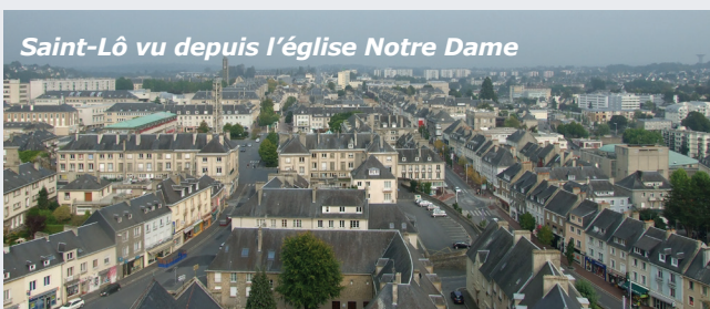
Saint-Lô vu depuis l'église Notre Dame

Ce dispositif est financé à hauteur de 50 % par l'Anah et 25 % par la Caisse des Dépôts et Consignations. Le reste est à la charge de la ville de Saint-Lô.