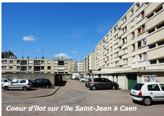
Coeur d'îlot sur l'île Saint-Jean à Caen