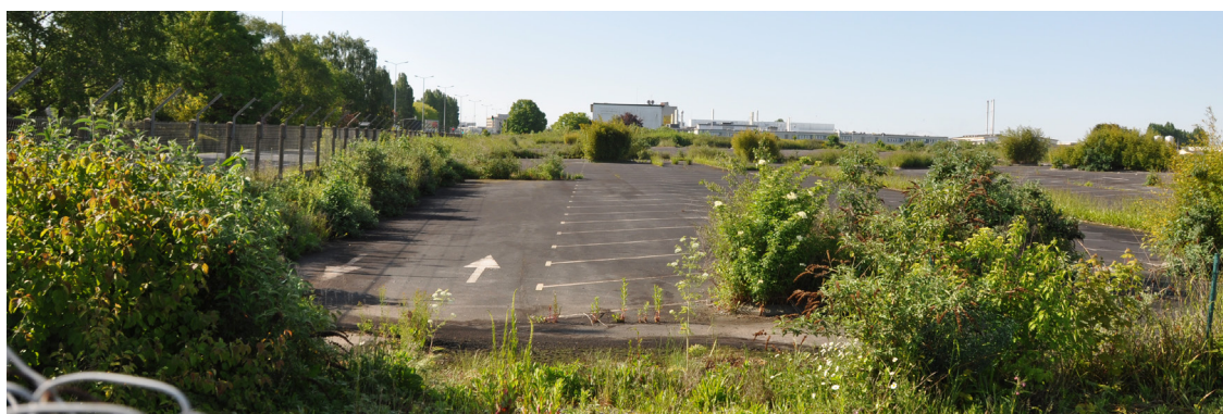
IPDIA, sur le plateau Nord de Caen

Une friche est un espace délaissé ou à l'abandon depuis plus d'un an à la suite de son arrêt d'activité.