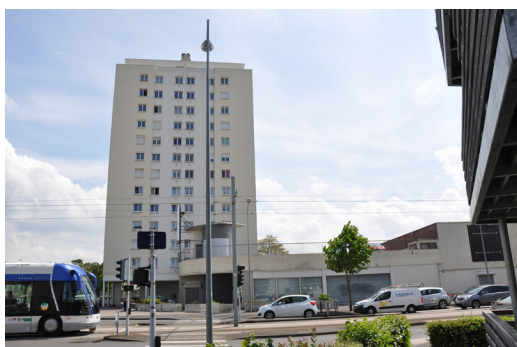
L'ancien magasin Darty, quartier de la Guérinière à Caen

Ces friches sont le produit d'une trop grande profusion de centres commerciaux situés en périphérie des villes. Elle provoque la fermeture de petits centres commerciaux de proximité qui ne génèrent plus assez de bénéfice, mais également de centres commerciaux d'ancienne génération situés en périphérie ou au sein des quartiers d'habitat social.