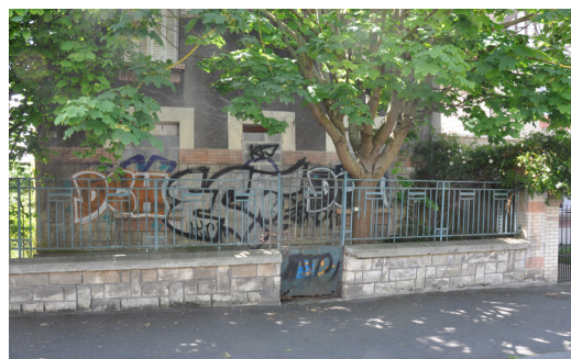
Une maison murée depuis plusieurs années, rive droite à Caen

On peut réunir la majorité de ces friches sous la dénomination très souvent utilisée de friche urbaine. En se localisant dans les espaces urbains, ce sont celles qui suscitent le plus d'intérêt.