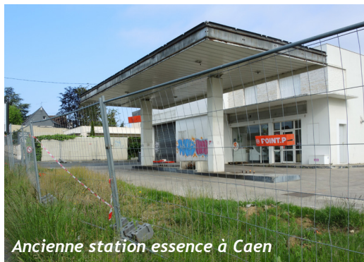
Ancienne station essence à Caen

Les actions de dépollution et les projets de reconversion de friches sont régis par la loi Risques de juillet 2003. Elle indique que le terrain sera dépollué selon son usage futur. Les méthodologies édictées par le ministère du Développement Durable en 2007 mettent en place des démarches adaptées dont celle du plan de Gestion qui détermine les différentes opérations à conduire en cas de pollution du site. Le traitement des friches s'oriente plutôt vers des quar-