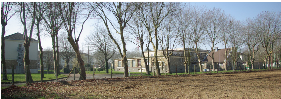
Site de l'ancien 18 e régiment de transmission à Bretteville-sur-Odon

Depuis plusieurs décennies, les évolutions stratégiques et l'introduction massive de la technologie a rendu obsolète de nombreuses implantations militaires. Suite à cette réorganisation des forces militaires, des friches militaires, espaces et bâtiments militaires, se sont constituées.