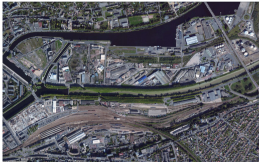
La presqu'île de Caen, un espace en friche ?

Ce sont souvent ces friches qui sont l'objet d'études, car elles constituent des enjeux majeurs. De par leur localisation, elles nécessitent parfois une dépollution lourde qui les positionne hors des marchés fonciers et immobiliers.