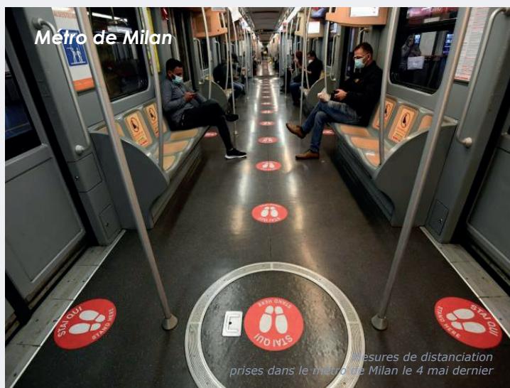
mesures de distanciation prises dans le métro de Milan le 4 mai dernier

Le vélo est un mode individuel, économe et efficace. Conciliant respect des règles sanitaires et de l'environnement, il semble être un précieux allié des collectivités pour compenser les difficultés du transport public et organiser la reprise de la mobilité quotidienne.