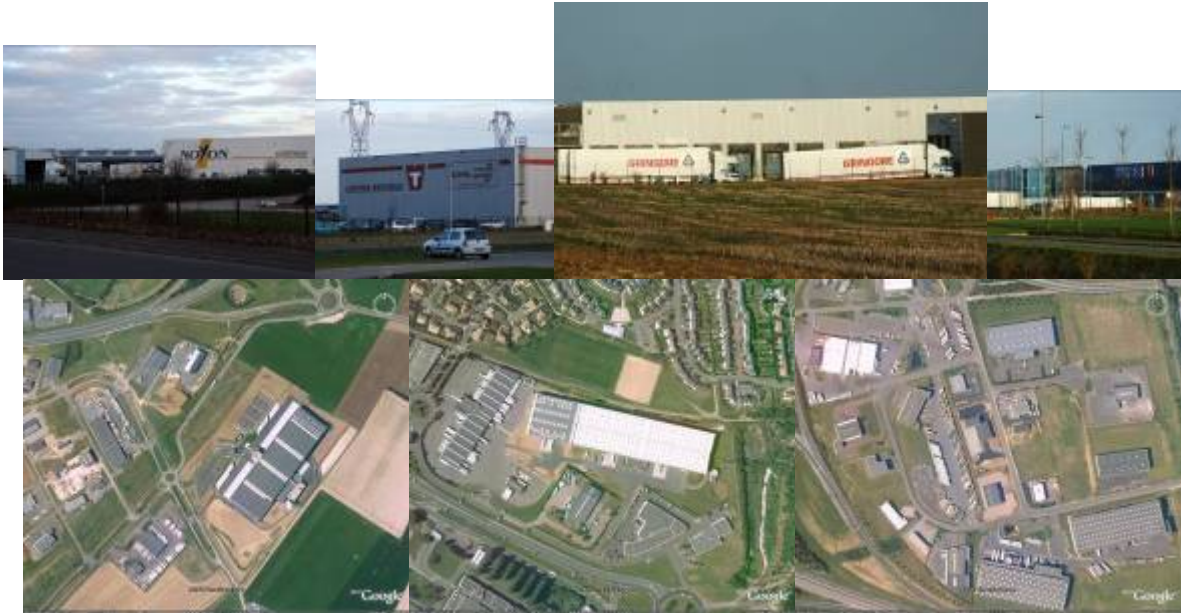
La logistique, au sud et à l'est de l'agglomération

Enfin, le développement des échanges et l'externalisation de la fonction transport des entreprises ont abouti à la création de vastes zones logistiques dans lesquelles cohabitent, à proximité des grands axes de circulation, « entrepôts cathédrales » et parkings pour poids lourds, fortement consommateurs d'espace et peu denses en emplois.