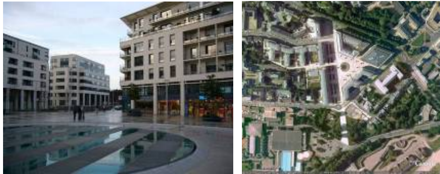
Gardin, un exemple de quartier urbain à l'architecture néo-classique de Caen

Le quartier Beaulieu et la Cité Gardin sont érigés également selon ces critères de mixité des fonctions. L'architecture de ces trois quartiers est assez semblable, d'un style simple et néo-classique.