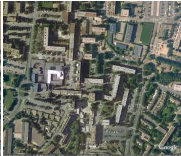
Hérouville, le Grand Parc

Les quartiers du Val et du Bois sont l'application stricte de cette forme : ils sont à taille humaine et noyés par la verdure. Les autres quartiers, le Grand Parc et la Haute-Folie par exemple, même si on y retrouve un bon nombre de principes évoqués auparavant, ressemblent davantage à une ZUP traditionnelle du fait de la hauteur des immeubles qui y ont été édifiés, et du peu d'originalité de l'architecture.