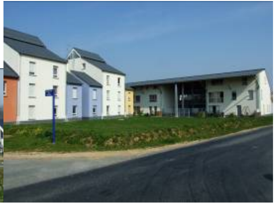
↑ Louvigny, ZAC du long cours ↑