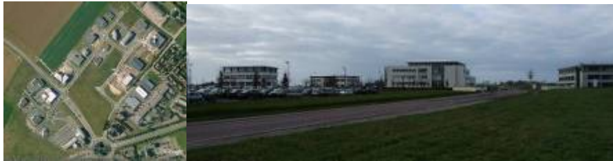
Le Parc Athéna : parc tertiaire des années 2000