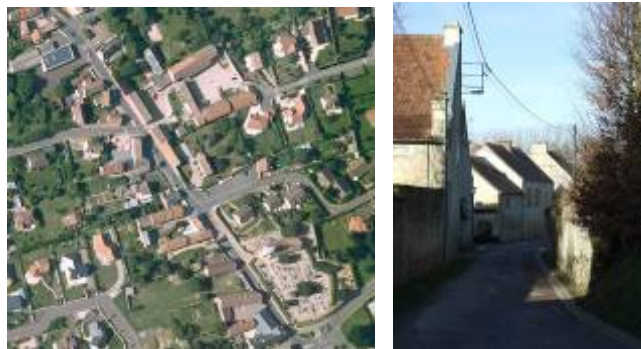
Le bâti ancien dans un village de la plaine

L'habitat se compose de grosses fermes articulées autour d'une cour fermée, de fermes plus modestes et de simples maisons en pierre calcaire. Les maisons sont perpendiculaires à la rue centrale, bordée de hauts murs de pierre. Ces murs permettaient de concentrer les allées et venues sur un espace minimal commun à tous les bâtiments, de protéger des vents et des courants d'air et de minimiser les vols ou déprédations.