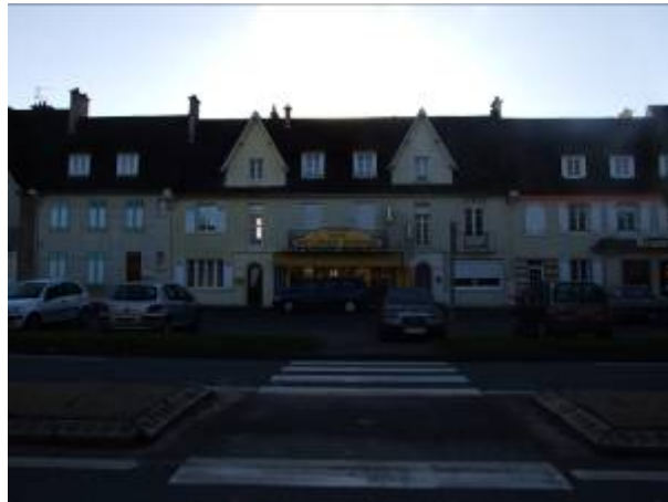
le centre reconstruit de Cagny, en bordure de la RN13