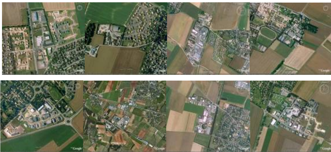
Exemples de petites zones d'activités en secteur périurbain

Compte-tenu des règles de la fiscalité locale et notamment de celles liées à la taxe professionnelle, l'accueil des activités économiques a fait l'objet d'une forte compétition entre les communes, qui s'est traduite par la multiplication des zones d'activités sur le territoire du SCoT.