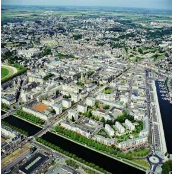
Vue en perspective en 2001

En matière architecturale, le parti choisi est la diversité et la simplicité. L'uniformité est rejetée, contrairement au Havre, au profit de directives générales relatives aux toitures, aux matériaux (la pierre de Caen) et aux volumes globaux qui confèrent cependant une certaine homogénéité à la reconstruction caennaise.