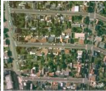
un îlot du quartier Ste Thérèse : une certaine densité (25 logt/ha)