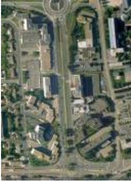
Le Péricentre des quartiers tertiaires des années 70/80