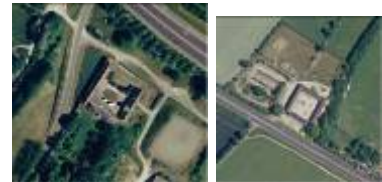
Exemples de fermes à cour carrée

L'habitat se compose de grosses fermes articulées autour d'une cour fermée, de fermes plus modestes et de simples maisons en pierre calcaire. Les maisons sont perpendiculaires à la rue centrale, bordée de hauts murs de pierre. Ces murs permettaient de concentrer les allées et venues sur un espace minimal commun à tous les bâtiments, de protéger des vents et des courants d'air et de minimiser les vols ou déprédations.