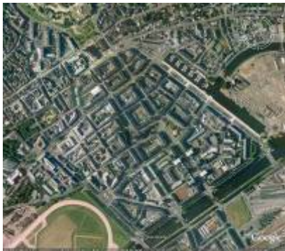
Vue aérienne en 2006

Le centre reconstruit de Caen : plan géométrie et perspectives majestueuses