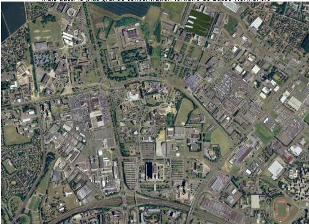
Le plateau nord, un espace très mixte, mais aussi la plus grande concentration tertiaire de Basse-Normandie