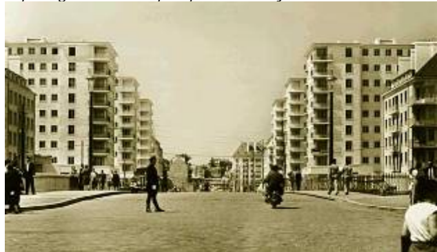
L'avenue du 6 juin en 1954