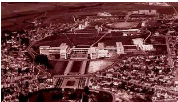
L'université en 1960