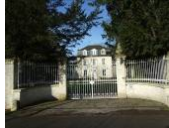
Exemples de manoirs et résidences bourgeoises de la plaine de Caen