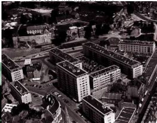
Le quartier des Quatran en 1960