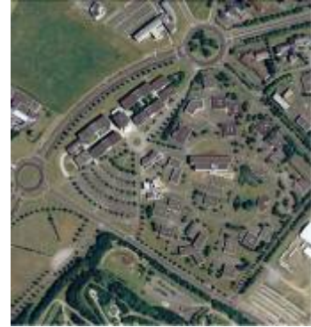
le technopole des années 90