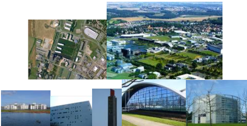
Citis – Hérouville-Saint-Clair : architecture design et cadre verdoyant