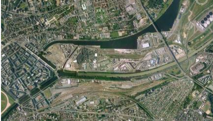
La Presqu'île de Caen : ancien espace industrialo-portuaire en voie de mutation lente

Le cœur économique historique de Caen est constitué notamment par le port et la presqu'île. La presqu'île est un vaste espace en mutation lente sur lequel subsiste un certain nombre d'activités qui constituent des « points durs » dans le paysage.