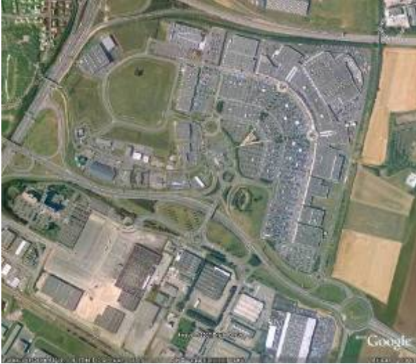
Une zone commerciale intégrée : Mondeville 2, dernier centre commercial de 2 me génération