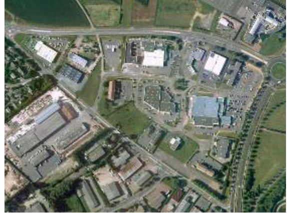
Un lotissement commercial classique : La zone du Clos Barbey à Saint-Contest