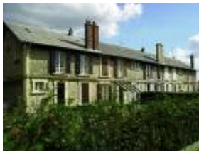
La cité de l'ex SMN : un quartier intercommunal

Une place importante est laissée à la nature : le plan urbain est très aéré et les maisons ont toutes leur propre jardinet. Jardinet qui a pour fonction de distraire les ouvriers par une occupation jugée saine.