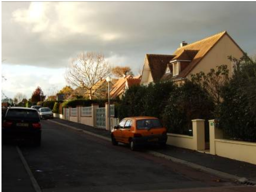
Un exemple typique de traitement des espaces publics en lotissement

La faible densité de ces quartiers, généralement monofonctionnels (uniquement voués à l'habitat), ne permet pas d'établir des commerces et des services. Néanmoins, sous l'effet d'une prise de conscience des risques liés à