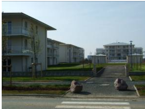
← Blainville s/O.