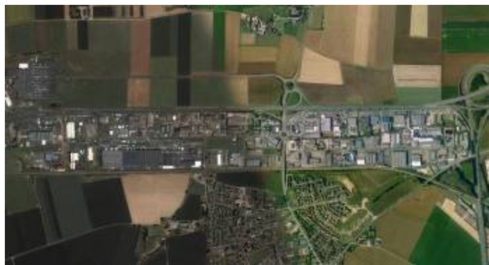
La Z.I. de Carpiquet : conçue pour un effet vitrine maximum