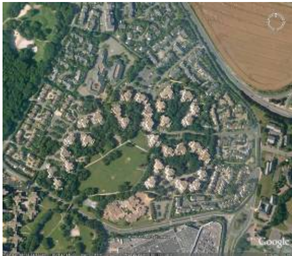
Hérouville, le Bois