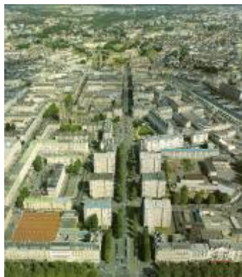
l'Avenue du 6 juin, vue en perspective aujourd'hui.