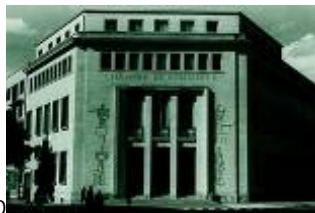
La CCI en 1960