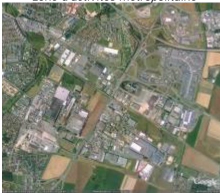
Le site Mondeville/ Cormelles/ Grentheville, un exemple de grande zone d'activités métropolitaine

Le territoire de l'agglomération caennaise reste fortement marqué par les grandes emprises industrielles liées, dans un premier temps, à l'implantation de la SMN, dont le site est en cours de reconversion, puis par celles héritées de la déconcentration industrielle de l'Île de France, promue par l'Etat dans les années 60.