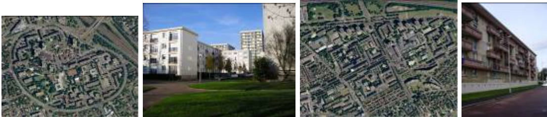
La Pierre Heuzé

Le bâti est constitué de tours et de barres qui ne déterminent pas la trame viaire : la rue, comme on l'entendait au cours des autres époques, n'existe plus. Les voies, larges afin de permettre une circulation automobile aisée, ne sont plus bordées par des bâtiments. Ceux-ci sont orientés en fonction du soleil.