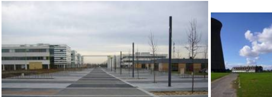
Normandial et Campus NXP – Colombelles : entre symbole du passé et modernité

Ces zones à forte image ont pour objectif d'être les vecteurs du rayonnement métropolitain de Caen.