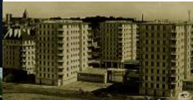
Les tours Marines en 1954