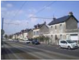
La rue Victor Lépine

Un ancien faubourg ouvrier en voie de « gentryfication » : le quartier des Fleurs