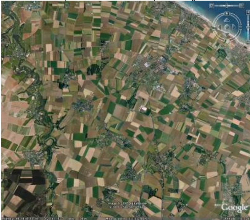
La plaine de Caen au nord, un openfield densément maillé par les villages

La plaine de Caen est traditionnellement une région d'openfield : l'habitat est groupé, autour de l'église et parfois de la mare. L'agencement de l'habitat forme des plans de bourgs sinueux qui témoignent de la manière spontanée de leur composition. Ces plans ne répondent à aucune règle d'organisation apparente. Néanmoins, deux logiques émergent : celle de contrainte du site de ces bourgs et celle de centralité, générée spontanément par les échanges.