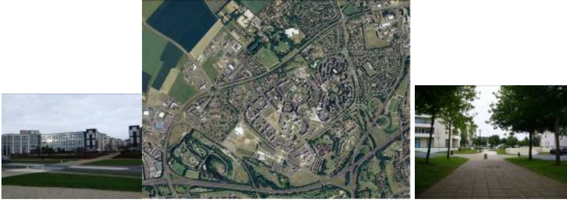
La Folie Couvertechef à Caen, une ZAC mixte achevée au début des années 2000

dans la fin des années 1990 par une autre zone mixte. Elle est composée d'immeubles de 5 à 6 étages, alignés sur les rues qui engendrent une densité relativement élevée. Les commerces et services, souvent en pied d'immeuble, permettent l'animation du quartier.