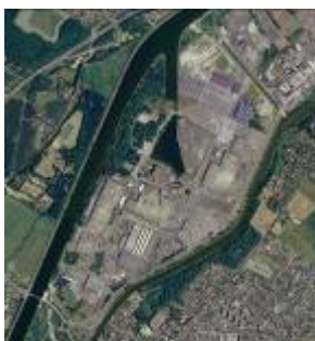
De l'usine au parc industriel : le site Renault Trucks,