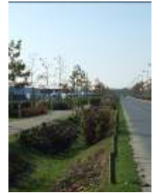
Le parc d'activités des Rives de l'Odon