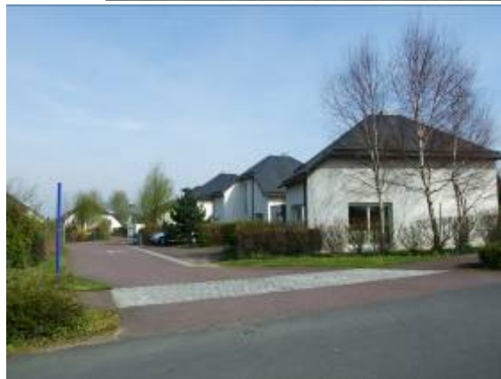
← Lebisey - Hérouville