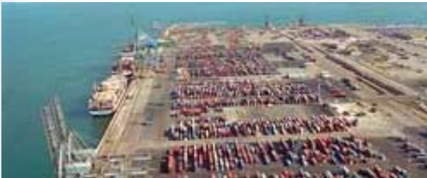
Quai de manutention de containers