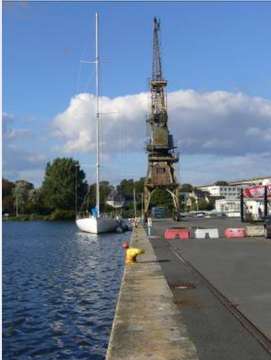
Caen : nouveau bassin