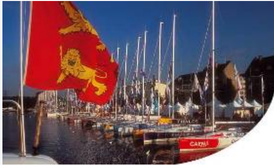
Bassin St Pierre