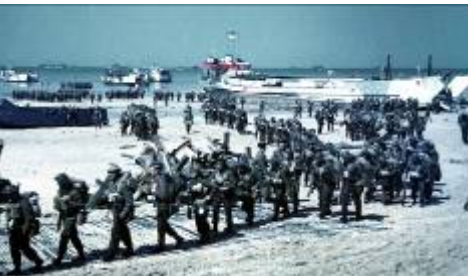
6 juin 1944 : débarquement canadien sur la plage de Bernières / mer – Image internet