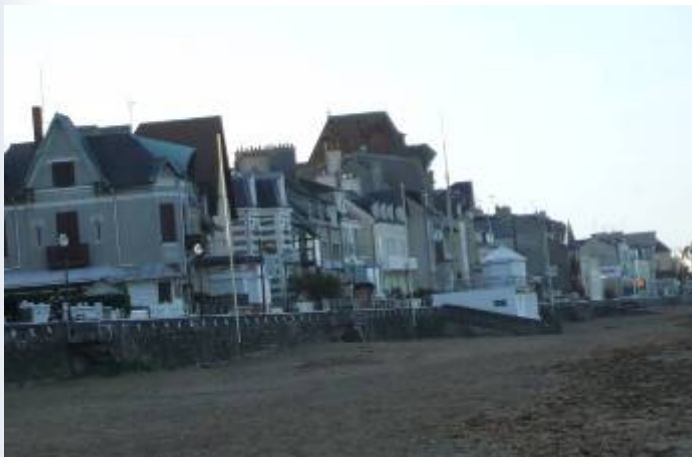
Saint Aubin sur Mer

A partir du début du XXème siècle, le littoral connaît le développement d'une nouvelle activité : le tourisme balnéaire.