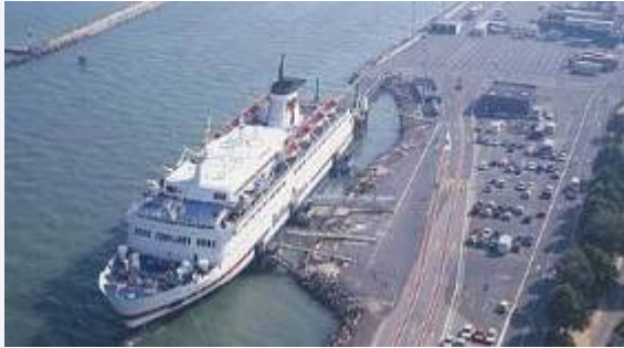
Ouistreham : le terminal Ferry - Image Brittany Ferries