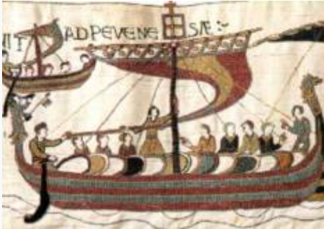
Extrait de la Tapisserie de Bayeux