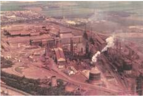
Ancienne usine SMN