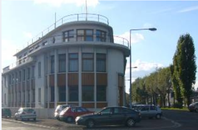
La Navale Caennaise