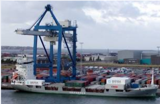
Déchargement d'un porte-containers