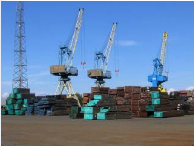
Quai de Blainville

Cependant, ville disposant d'un port, Caen n'a jamais réellement été une ville-port.