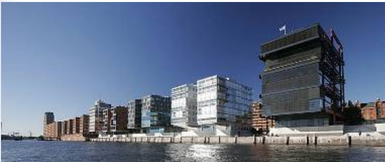
Hafencity – Hambourg (Allemagne)