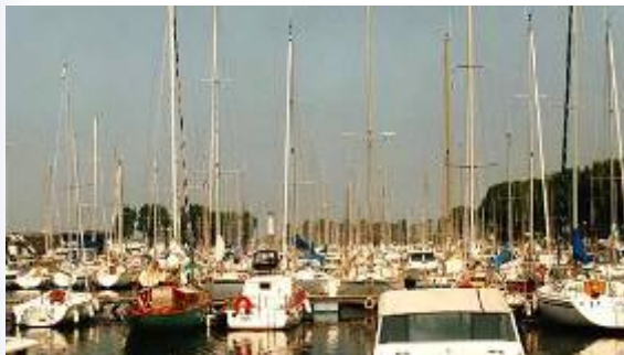
Ouistreham : le port de plaisance