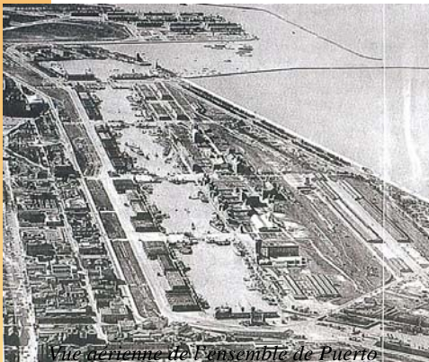
Vue aérienne de l'ensemble de Puerto Madero en 1940, alors tombé en obsolescence

Dès sa fondation, la ville de Buenos Aires rencontra des problèmes pour l'accueil des grands bateaux qui ne pouvaient charger et décharger ce qu'ils transportaient à cause de la faible profondeur du Rio de la Plata. Ainsi les bateaux qui ne pouvaient s'approcher de la côte devaient rester loin d'elle et décharger passagers et marchandises dans de grands charriots ou barques.