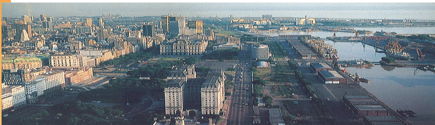
Puerto Madero est coupé du centre historique par son réseau de desserte ferroviaire et par deux avenues très passantes

Les premières études du projet débutent en 1985 dans le cadre d'une convention entre le secrétariat d'Etat aux transports (propriétaire des lieux) et la faculté d'architecture de l'université de Buenos Aires.