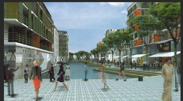
Le recours à des matériaux écologiques.

- Des espaces publics restreints, mais de qualité : ils sont peu nombreux afin de limiter les coûts, mais largement plantés et dimensionnés.